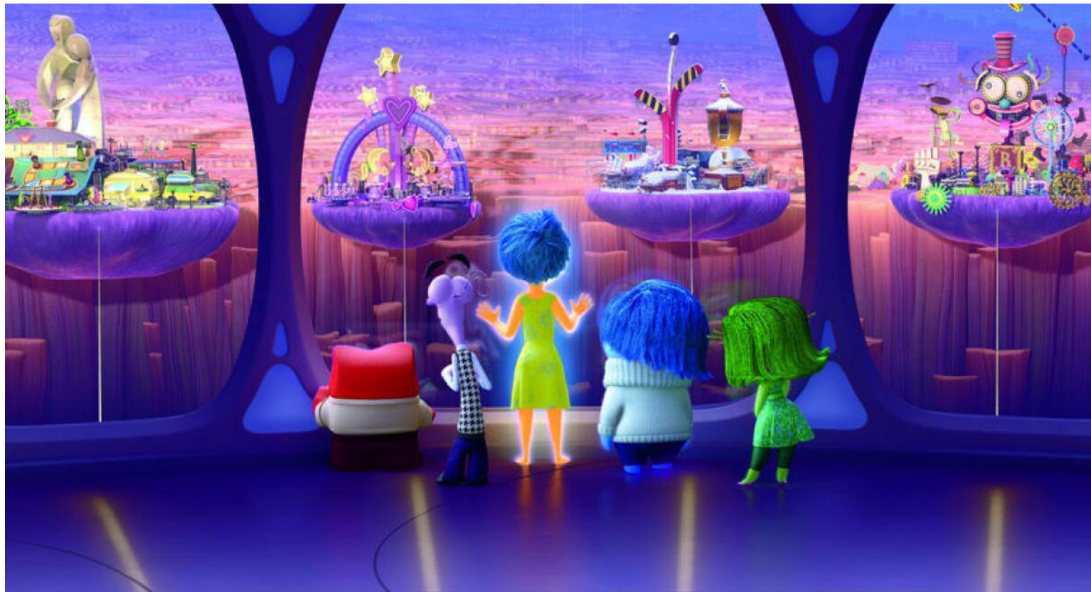
Inside Out | Publicity Still